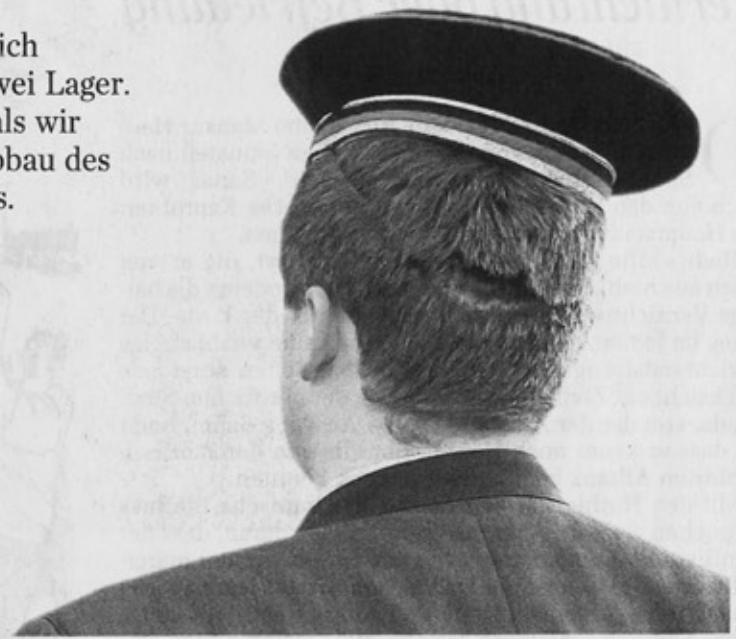
Wir (extremen) Rechten: mit Deckel auf dem Kopf gegen Gutmenschen.

■ Wir Linken wünschen uns eine bessere, gerechtere Welt für alle. (Wir Rechten nicht, vorher muss es unseren Leuten tiptopp gehen.) Doch leider mussten auch wir Linken zuletzt erkennen, dass unserer Kraft, unserer Vermögen und auch unserem Willen Grenzen gesetzt sind. Die Flüchtlingskrise machte es uns schmerzlich bewusst. Den Menschen, die kommen, muss geholfen werden, das ist selbstverständlich für uns. Aber was tun, und leider ist das ja nicht nur rechte Propaganda, wenn noch Millionen nach Europa kommen wollen. Hält unsere Einstellung der Realität dann noch stand? Dann nämlich müssten wir nicht nur ein paar Wochen oder Monate freiwillig helfen. Dann müssten wir ein völlig anderes Leben führen. Dann geschähe die gerechte globale Umverteilung, die wir politisch immer fordern, auf eine dramatische und unmittelbare Weise, die wir nicht vorhergesehen haben. Wie viele, selbst von uns, würden bereit sein dafür? Vermutlich nicht mehr als jene paar Tausend Ausnahmehenschen, die zuletzt durch ihren Einsatz dafür gesorgt